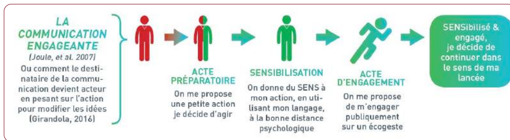
Figure : La communication engageante. (Source : Eriksson et Luciani, 2017).